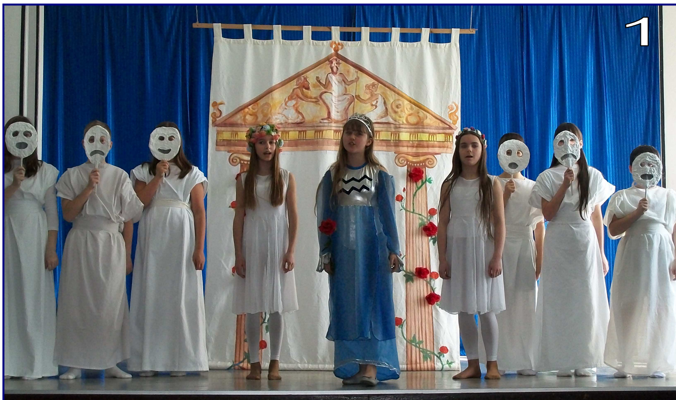
1- Nasz spektakl pt. „Ja, Narcyz”. Na scenie: Chór, Nimfy i Afrodyta.

Teatr z Kunowa zaprezentował się w bardzo zabawnym spektaklu pt. „Law, law, law”, w którym przedstawił perypetie księżniczki uparcie szukającej męża. Gospodarze zaś przedstawili sztukę na bazie scenariusza „One trzy, czyli krótka historia pewnego girlsbandu”, ukazującą marzenia nastolatek o karierze piosenkarskiej.